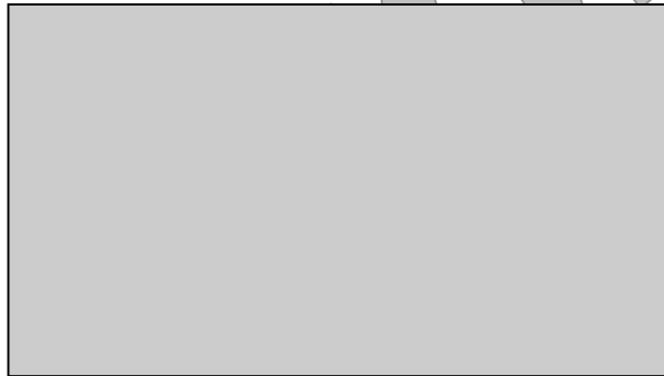
Wzór podpisu Klienta (pełne imię i nazwisko)